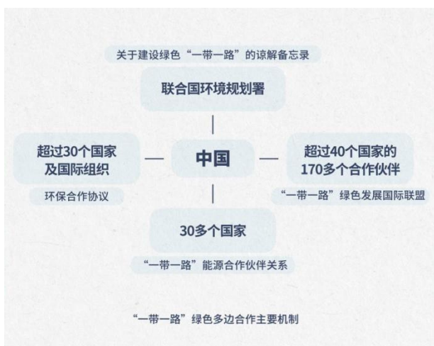
图6 “一带一路”绿色多边合作主要机制——全球生物多样性保护的积极引领者。

带一路”应对气候变化南南合作计划，打造“一带一路”能源合作伙伴关系，与超过40个国家的170多个合作伙伴建立“一带一路”绿色发展国际联盟。