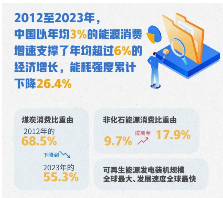
图 1 中国绿色发展成效

速支撑了年均超过 6% 的经济增长，能耗强度累计下降 26.4%，成为全球能耗强度降低最快的国家之一。