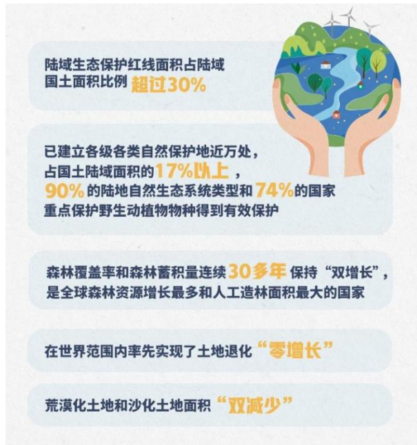
图 5 中国开展生态保护修复

河北塞罕坝机械林场，几十年来接续奋斗，创造了荒原变林海的人间奇迹，为京津冀地区筑起了一道高质量发展的绿色屏障，成为中国乃至全世界的荒漠治理典范，2017年获得联合国“地球卫士奖”。