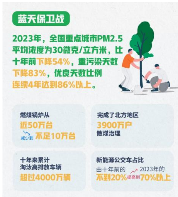
图 2 中国空气质量变化

3900 万户散煤治理。累计淘汰高排放车辆超过 4000 万辆，新能源公交车占比由十年前的不到 20% 提高到 2023 年的 70% 以上，大宗货物清洁运输水平持续提升。