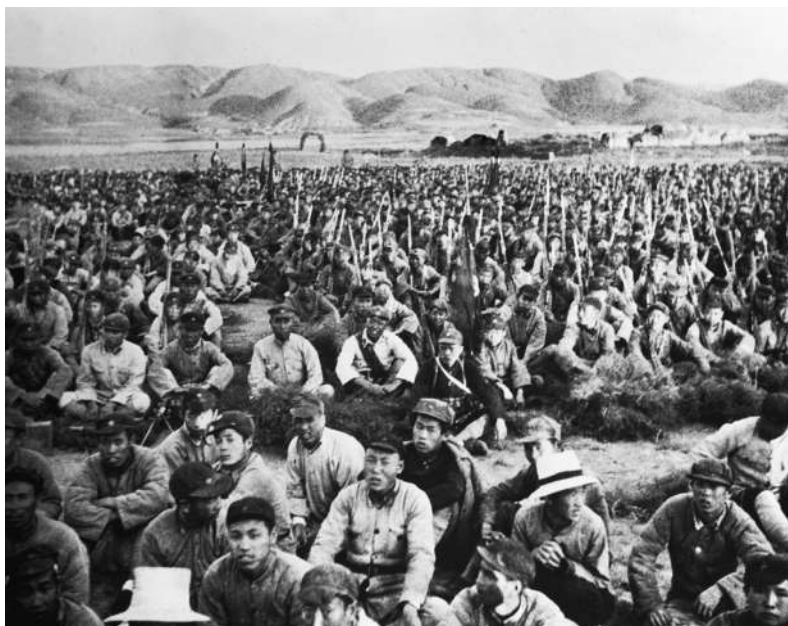
红军第一军团在宁夏

这种凝聚人心、团结奋进的精神纽带与时俱进。今天，中国各族人民“像石榴籽一样紧紧抱在一起”，交往交流交融的深度和广度前所未有。从中国土壤里长出来的“新型政党制度”，把中国共产党和民主党派、无党派人士亲密团结起来，形成“同心圆”。在社会治理领域，“共建共治共享”的理念把政府、社会、公众等多方主体团结起来，凝聚起良性的治理合力。在民生保障领域，全国统一应急调度、东西部协作、对口