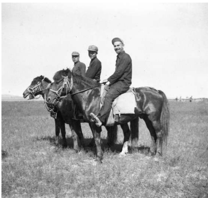
1936年，斯诺（右）在陕北采访途中（资料照片）。

1936年，美国记者埃德加·斯诺冲破严密封锁，深入陕甘宁革命根据地，以实地见闻著成《红星照耀中国》。新中国成立后，他又三次访问中国，记录下新中国的发展与变革。