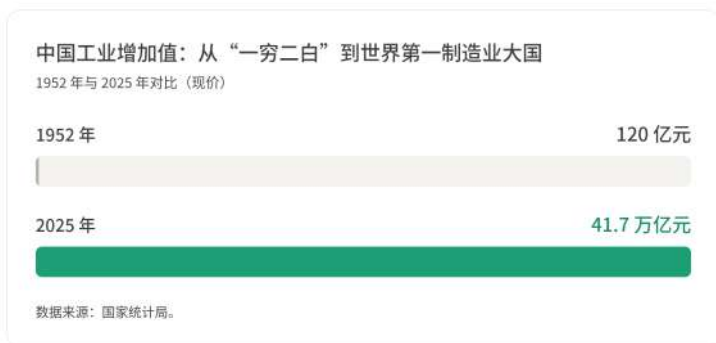
图表：1952年和2025年中国工业增加值对比

产业分类中全部工业门类的国家；制造业增加值占全球比重已接近30%，总体规模连续15年位列全球第一 ① 。“中国制造”已经全面向“中国创造”“中国智造”迈进，为中国社会高质量发展注入强大动能。2010年以来，中国一直保持世界第二大经济体地位，2025年国内生产总值首次跃上140万亿元新台阶，在全球经济增长整体承压的背景下，对世界经济增长的年均贡献率连续5年保持在30%左右 ② 。