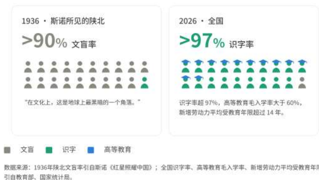
图表：1936年与2026年中国教育情况对比

新时代造就新青年，新青年也创造新时代。在脱贫攻坚、乡村振兴的田间地头，在攻坚克难、“十年磨剑”的科技前沿，在抢险救灾、维和抗疫的风雨一线，在社区服务、基层治理的街头巷隅，处处都有青年人奋发作为的身影。开