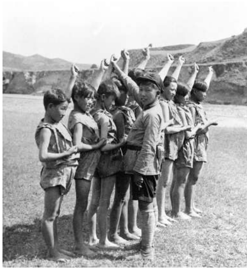
“红小鬼”们在做游戏

然而，在物质的窘迫中，斯诺却看到了全中国“最充满希望的一群人”。他在《红星照耀中国》中写道，红军战士是“所看到过的第一批真正感到快活的中国无产者” ① ，他们脸上都洋溢着一种当时中国人罕见的自尊与朝气。他所遇见的“红小鬼”，总是愉快而乐观，“大人们看到了他们，就往往会忘掉自己的悲观情绪。” ②