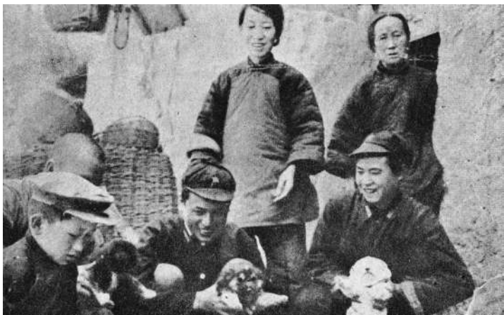
1937年在陕北根据地，红军和农民在一起（资料照片）。

虎”毅然放下了手中的风箱与锅盘。他没有行囊，只穿着一双草鞋、一条裤子就赶去参军。红军所到之处，百姓都会自发捧上热茶、送上吃食。 ① 据英国记者詹姆斯·贝特兰观察，红军在长征沿途吸纳十余省工农子弟投身抗日救国，“这支军队比起其他任何军队来更堪称为中国人民的代表。” ②